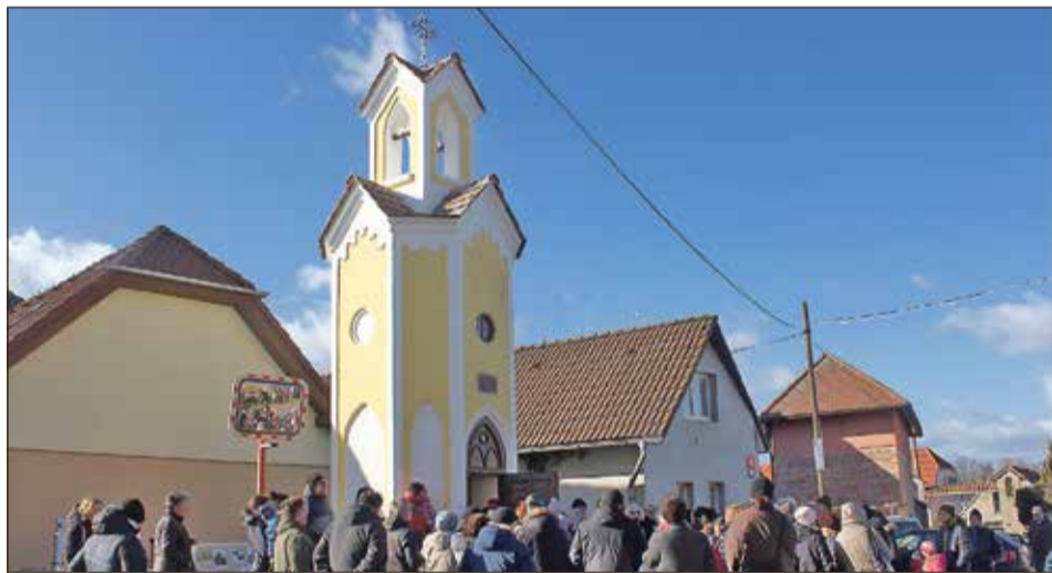
Svěcení sobínské kapličky se zlatou Madonou ke cti a chvále Boží.