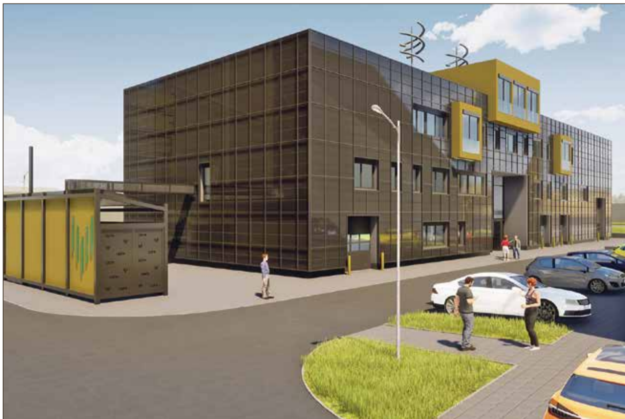
CEETe má být postaven ze stejných modulů, podobným stavebnici Lego.

Protože nové CEET má být postaveno jako výzkumně-vývojové, půjde o CEETe (e jako explorer, což v překladu znamená průzkumník, výzkumník či badatel – pozn. red.). „Půjde o cestu vývojového centra. Na druhou stranu cílíme na vysokou úroveň technického řeše-